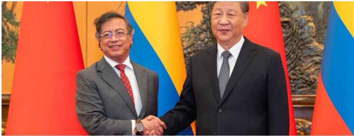
Los gobiernos de Colombia con el presidente, Gustavo Petro y la República Popular China con el presidente Xi Jinping, formalizaron un Memorando de Entendimiento en el marco de la Iniciativa del Cinturón y la Ruta, la ambiciosa propuesta de infraestructura y conectividad conocida como la Nueva Ruta de la Seda.

«Si logramos equilibrar nuestra balanza comercial con China, Colombia se convertiría en un país mucho más próspero», afirmó Petro, enfatizando que el aumento de las exportaciones y la atracción de inversión productiva china fortalecerían la capacidad de pago de la deuda externa y