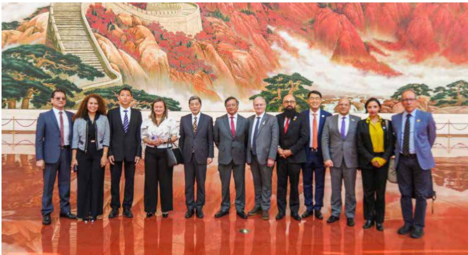
El presidente Gustavo Petro acompañado por los miembros de la delegación colombiana durante la visita al Museo del Partido Comunista de China

El Museo del Partido Comunista de China, inaugurado en 2021, es una institución dedicada a la historia del Partido Comunista Chino (PCCh). Se ubica en Beijing, cerca del Parque Olímpico.