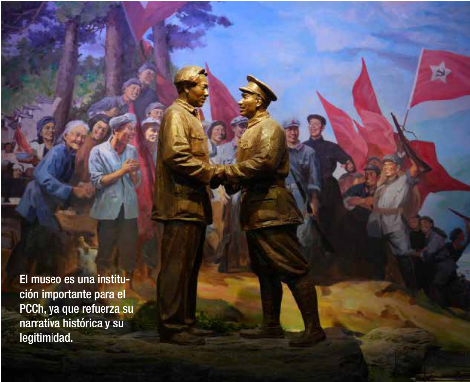
El museo es una institución importante para el PCCh, ya que refuerza su narrativa histórica y su legitimidad.