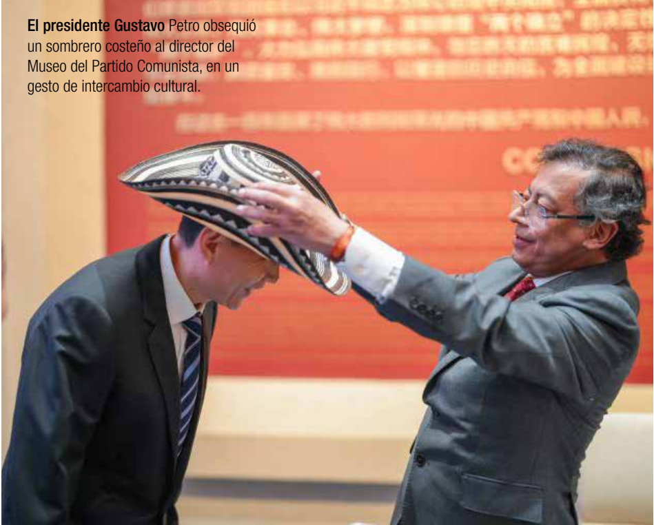
El presidente Gustavo Petro obsequió un sombrero costeño al director del Museo del Partido Comunista, en un gesto de intercambio cultural.