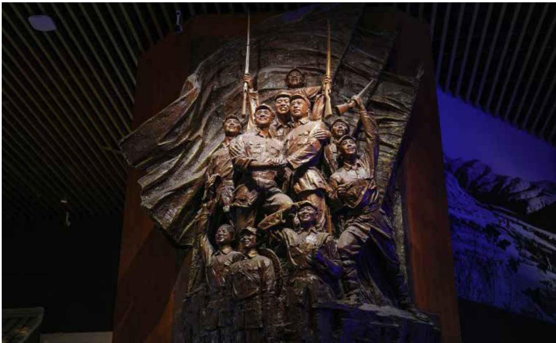
El museo se centra en la historia del Partido Comunista Chino a lo largo de los años