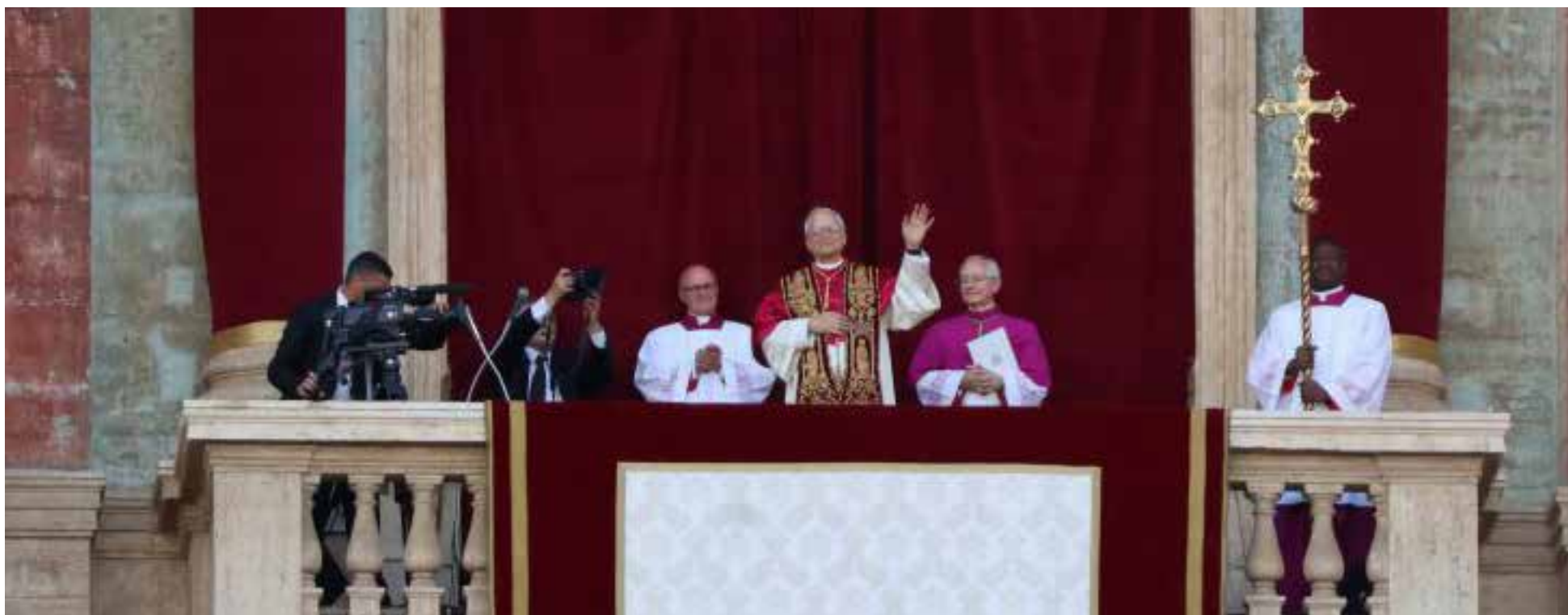
Papa León XIV

A raíz de la elección de nuevo Papa se han podido construir toda clase de interpretaciones, acertadas muchas de ellas, exageradas otras, aunque han comenzado a aparecer en el youtube los primeros asomos de las patalletas de los derrotados por su designación. Tanto que puede uno creer que por haber madrugado a ponerle puyas, es el fantasma de cisma el que sigue latente.