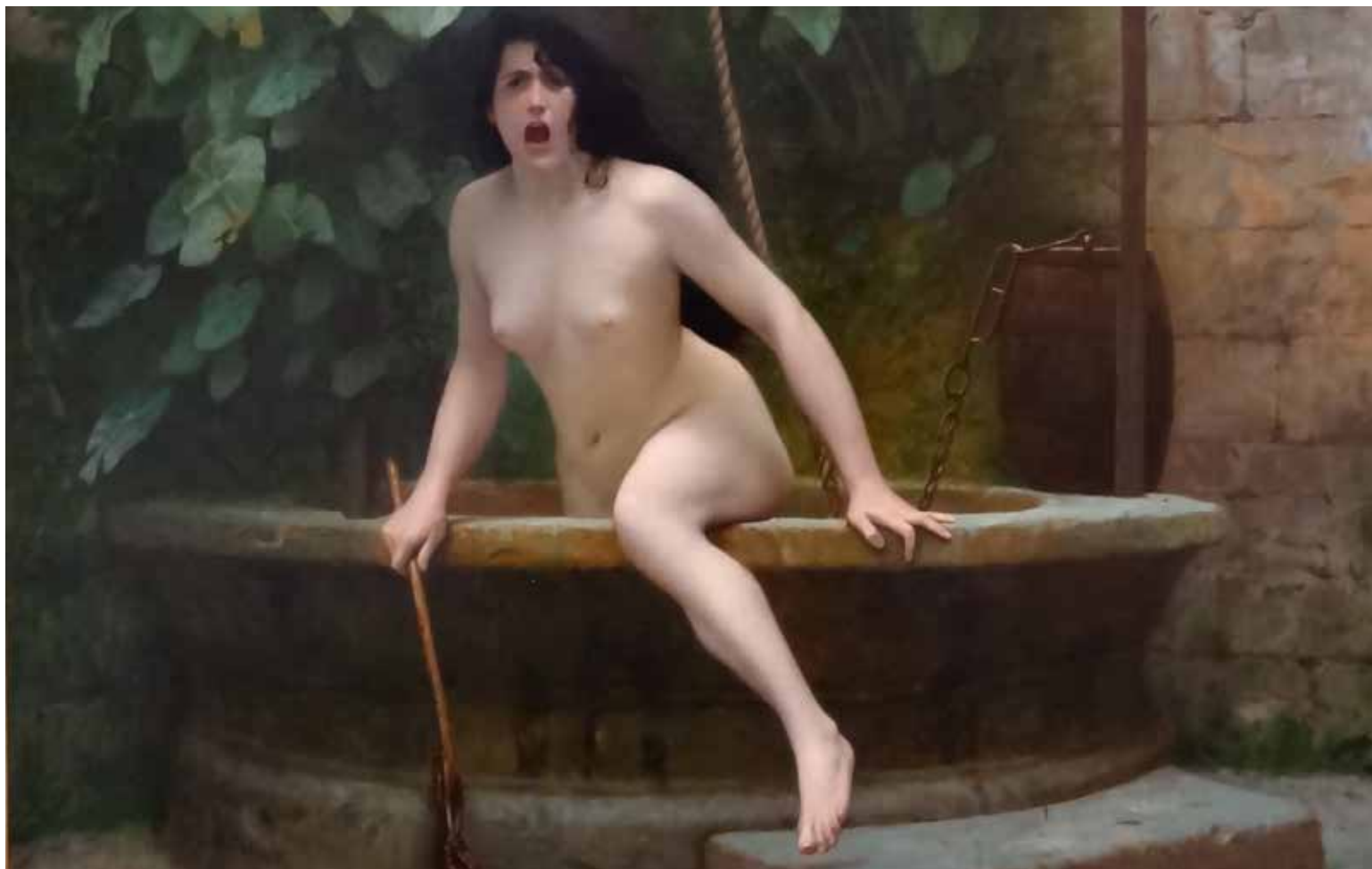
La verdad que sale del pozo para castigar a la humanidad, obra de Jean Léon Gerome 1896