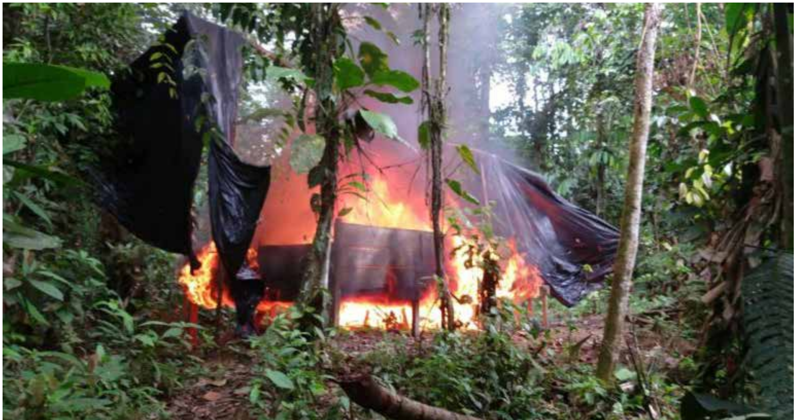
Los operativos culminaron con el hallazgo y la destrucción controlada de un total de 54 laboratorios clandestinos dedicados al procesamiento de pasta base de cocaína y dos complejos de producción de clorhidrato de cocaína.

Según la información oficial emitida por el Ejército Nacional, estas acciones militares fueron el resultado de un exhaustivo trabajo de inteligencia que permitió identificar y ubicar estas instalaciones ilegales en