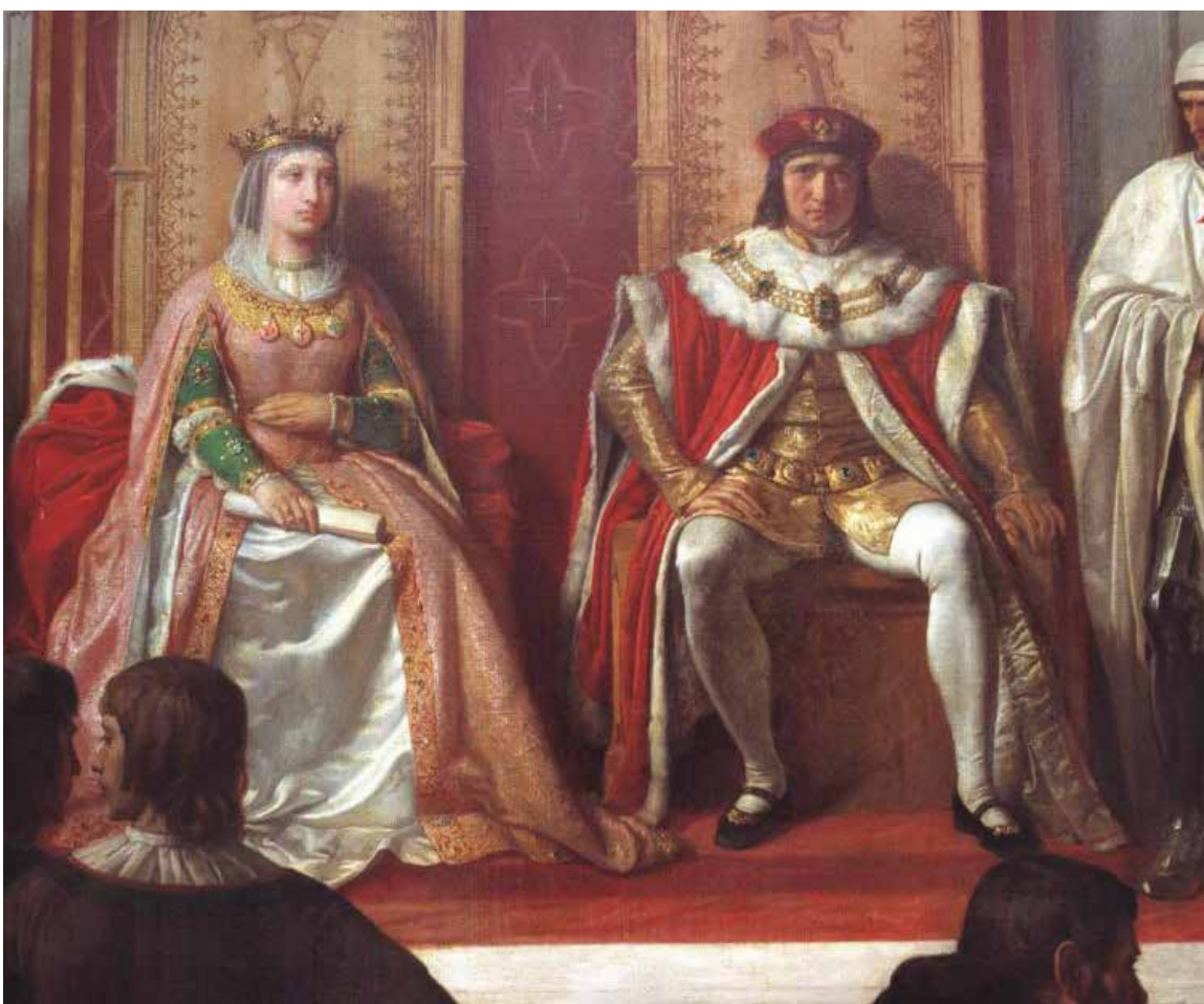
Los Reyes Católicos administrando justicia

La ocupación árabe en España dejó hondas huellas en el comportamiento humano y social. Aportaron los invasores al idioma por lo menos cuatro mil palabras, entre las cuales almojábana, almohada, aduana, aldeia, azote, noria, tamarindo, zaguán, baladí y algunos gentilicios. También aceite, aceituna, cacahuete, alambique,