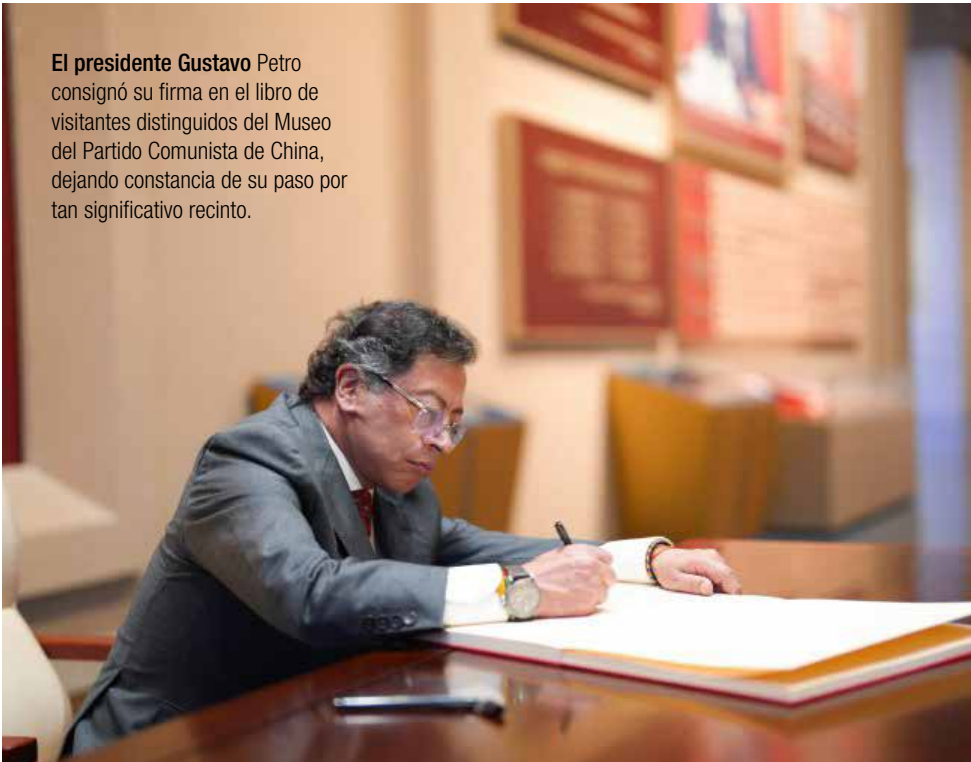
El presidente Gustavo Petro consignó su firma en el libro de visitantes distinguidos del Museo del Partido Comunista de China, dejando constancia de su paso por tan significativo recinto.