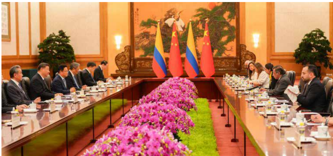
El presidente Petro ha manifestado su firme intención de equilibrar esta balanza comercial, cuyo déficit actual ronda los 14 mil millones de dólares, ya sea a través de un aumento significativo de la inversión china en Colombia

La magnitud de China como socio comercial y estratégico para Colombia es innegable. Con una población de 1.409 millones de habitantes en un territorio nueve veces mayor, un Producto Interno Bruto (PIB) promedio de US$ 18.273 billones en la última década y un ingreso per cápita de US$ 12.597 (superando el de Colombia, que se sitúa por encima de los US$ 7.000 en 2024), el gigante asiático representa un mercado de oportunidades vastísimo. Sus indicadores económicos de 2024, con una inflación controlada del 1% y una tasa de desempleo del 5,1%, sumados a una Inversión Extranjera Directa