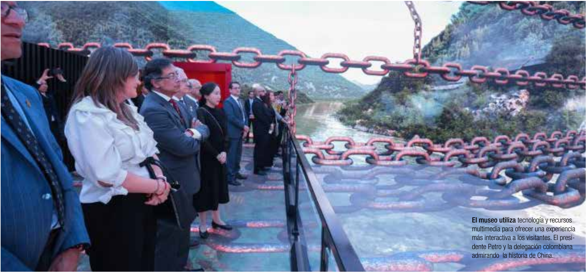
El museo utiliza tecnología y recursos multimedia para ofrecer una experiencia más interactiva a los visitantes. El presidente Petro y la delegación colombiana admirando la historia de China.